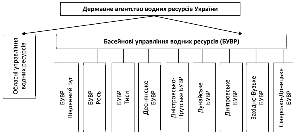
Рис. 1. Структура Державного агентства водних ресурсів України

вових та економічних особливостей його застосування. Згідно з п. 255.1 статті 255 Податкового кодексу України платниками рентної плати за спеціальне використання води (далі – Рента плати) є водокористувачі – суб'єкти господарювання незалежно від форми власності, які використовують воду, отриману шляхом забору води з водних об'єктів (первинні водокористувачі) та/або від первинних або інших водокористувачів (вторинні водокористувачі).